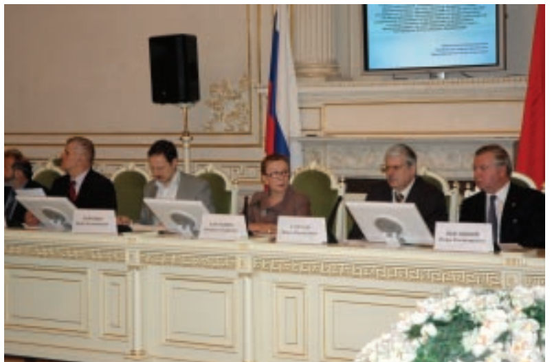
Депутаты ЗС Петербурга, члены постоянной комиссии по социальной политике и здравоохранению