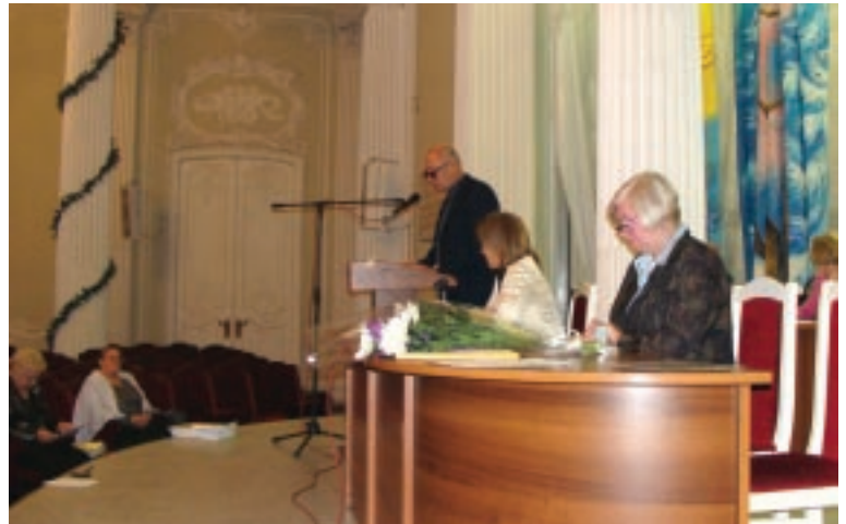
Президиум Пленума Теркома профсоюза

2.4. Провести обучение председателей первичных организаций по изучению федерального закона «Об охране здоровья граждан в РФ», обратив особое внимание на статьи