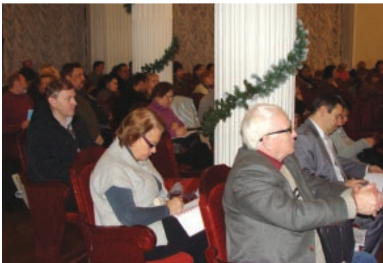
Члены Территориального комитета на заседании Пленума

На пленуме также был решен ряд текущих организационных вопросов, были рассмотрены предварительные финансовые итоги 2012 года и основные показатели профсоюзного бюджета территориальной организации на 2013 год.