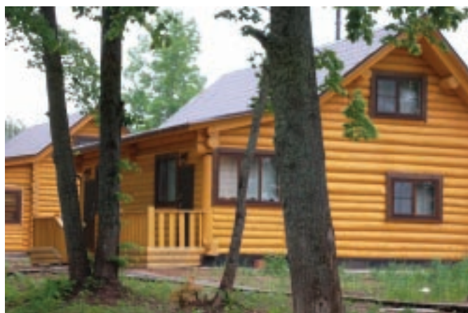
Новые коттеджи для пациентов санатория

Поздравляем профсоюзную организацию санатория «Красный Вал», всех его сотрудников с юбилеем и желаем дальнейших успехов!