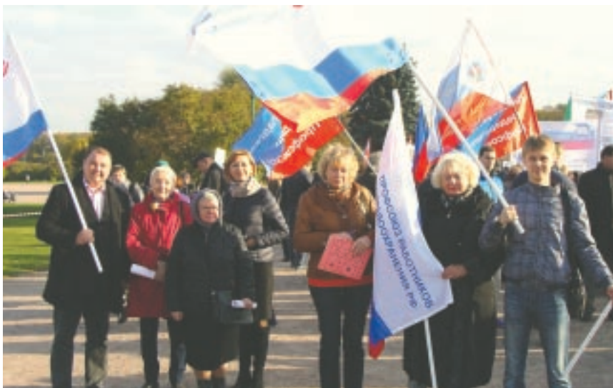
Медики - участники профсоюзного митинга на Марсовом поле

тий! Мы полностью поддерживаем позицию ФНПР в связи с войной санкций на международной арене и военными действиями на Украине. Мы призываем все страны отказаться от экономических санкций как средства разрешения политических разногласий. Мы призываем профсоюзы всех стран развернуть борьбу за мир без войн и экономических санкций. Мы за справедливое общество и достойную жизнь!»